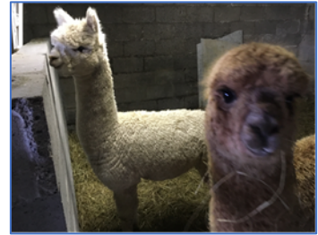
Vulcain et Velvet dans le box de sevrage

Le sevrage est un moment très stressant pour le cria et sa mère ; les crias ne manqueront pas de vous le rappeler, à grand renforts de « pleurs », souvent pendant plusieurs jours. Afin d'éviter tout stress supplémentaire, il convient d'empêcher tout contact, même auditif, visuel ou olfactif ; vous devrez donc idéalement disposer d'un enclos ou d'une étable suffisamment grande et qui ne fasse pas face à, ni ne soit trop proche de l'enclos maternel.